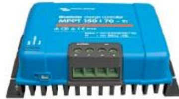
Controlador de carga solar MPPT 150/70-Tr