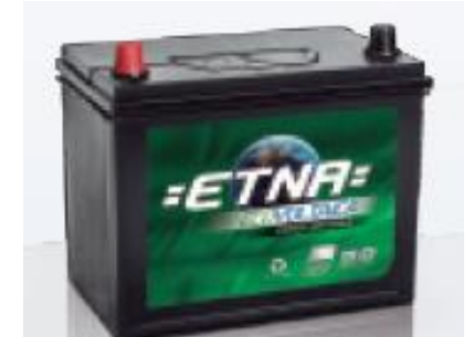
Batería Ecovoltaica 100 AH y de 60 AH