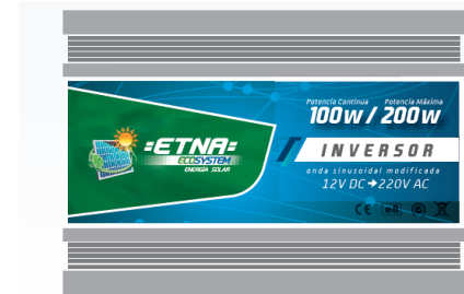
Inversor 100 watts